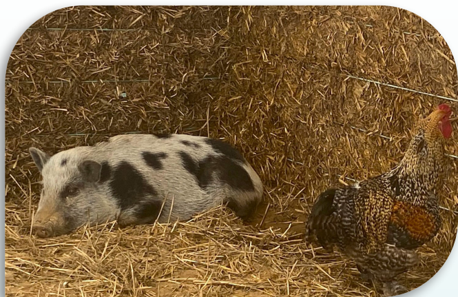
La mini ferme